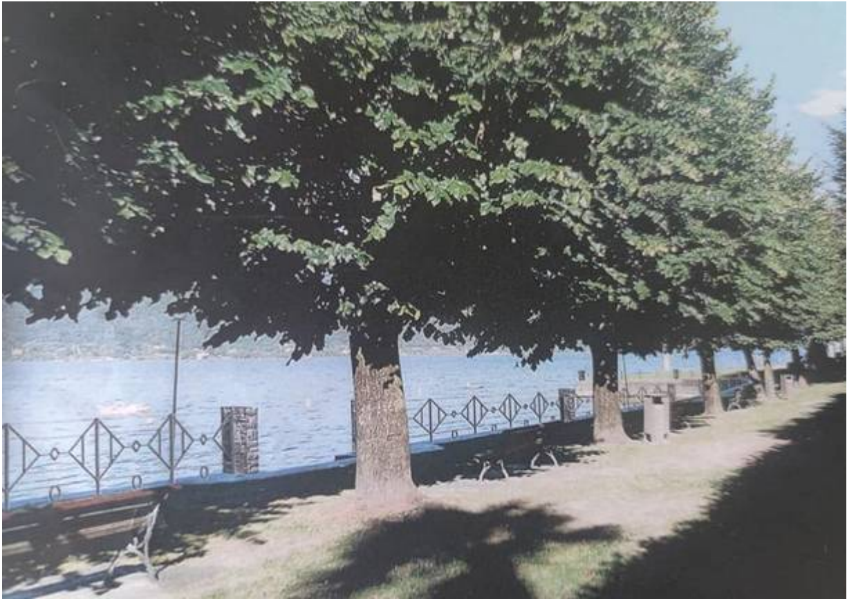
I due progetti dell'amministrazione leggiunese