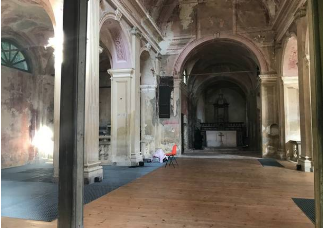
San Giovanni a Casciago

Altri Comuni hanno scelto di provare a intercettare i fondi non per avviare interventi su patrimonio oggi inutilizzato, ma per rimettere mano a ciò che già c'è: valga l'esempio di Cardano al Campo , che vorrebbe usare i fondi per ammodernare il municipio. Stesso investimento farà anche Samarate , con l'obiettivo di arrivare ad ampliare il municipio e "liberare" altri spazi (un'altra sede comunale – oggi usata come ufficio tecnico – tornerebbe utilizzabile come sala pubblica).