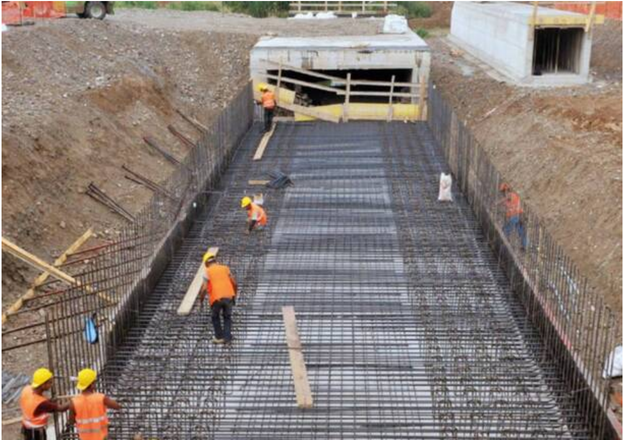
Cantiere di Pedemontana

Se il dato nazionale è preoccupante, in pianura padana diventa emergenza. Con un picco in Lombardia, passata dall'11,54% del suolo consumato nel 2006 al 12,1 del 2021.