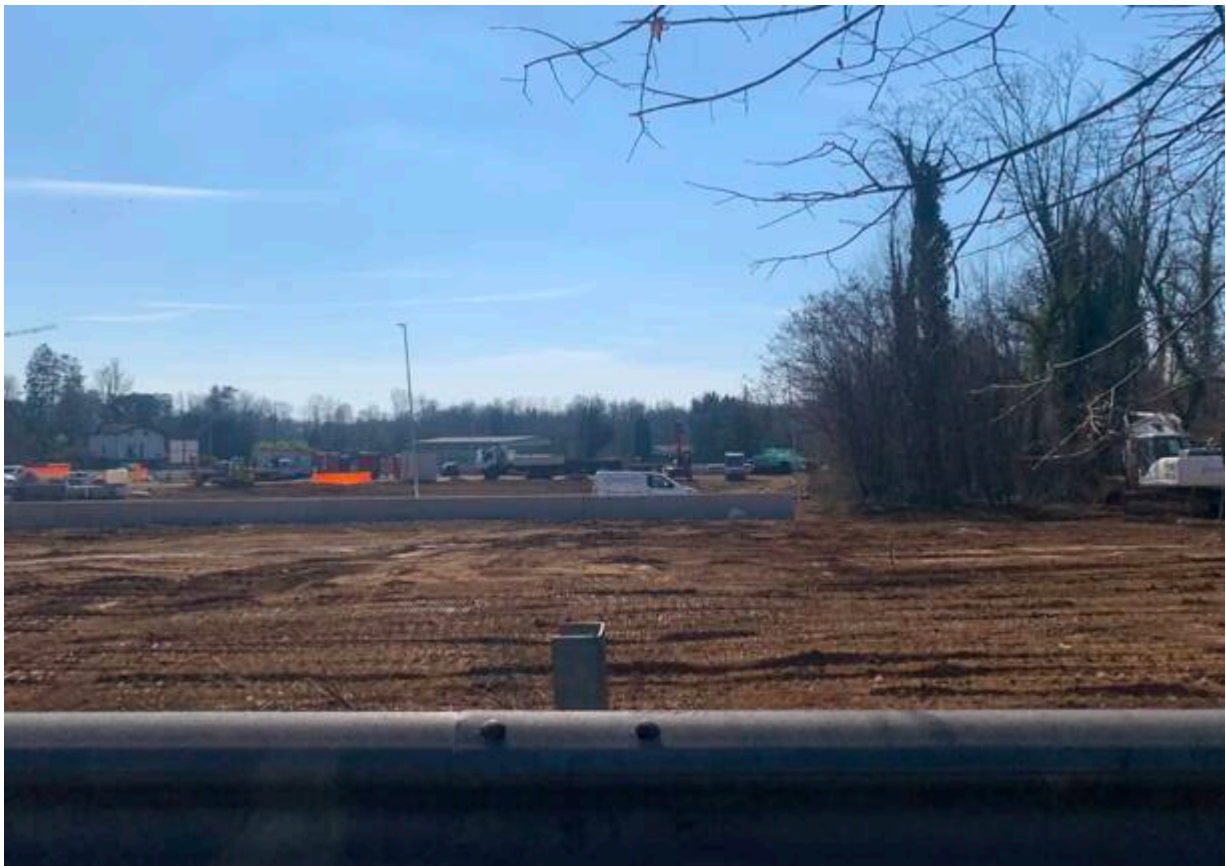
Cantiere in allestimento a Casorate Sempione, nuova ferrovia Gallarate-Malpensa

Terzo tema: il suolo è custode di carbonio , conserva quattro volte la quantità di carbonio che c'è in atmosfera e che oggi preoccupa per i cambiamenti climatici. Il grosso del carbonio rimane sottoterra, «a meno che non andiamo lì con una ruspa. Ma nell'impatto della costruzione di un'autostrada questo aspetto non viene calcolato».