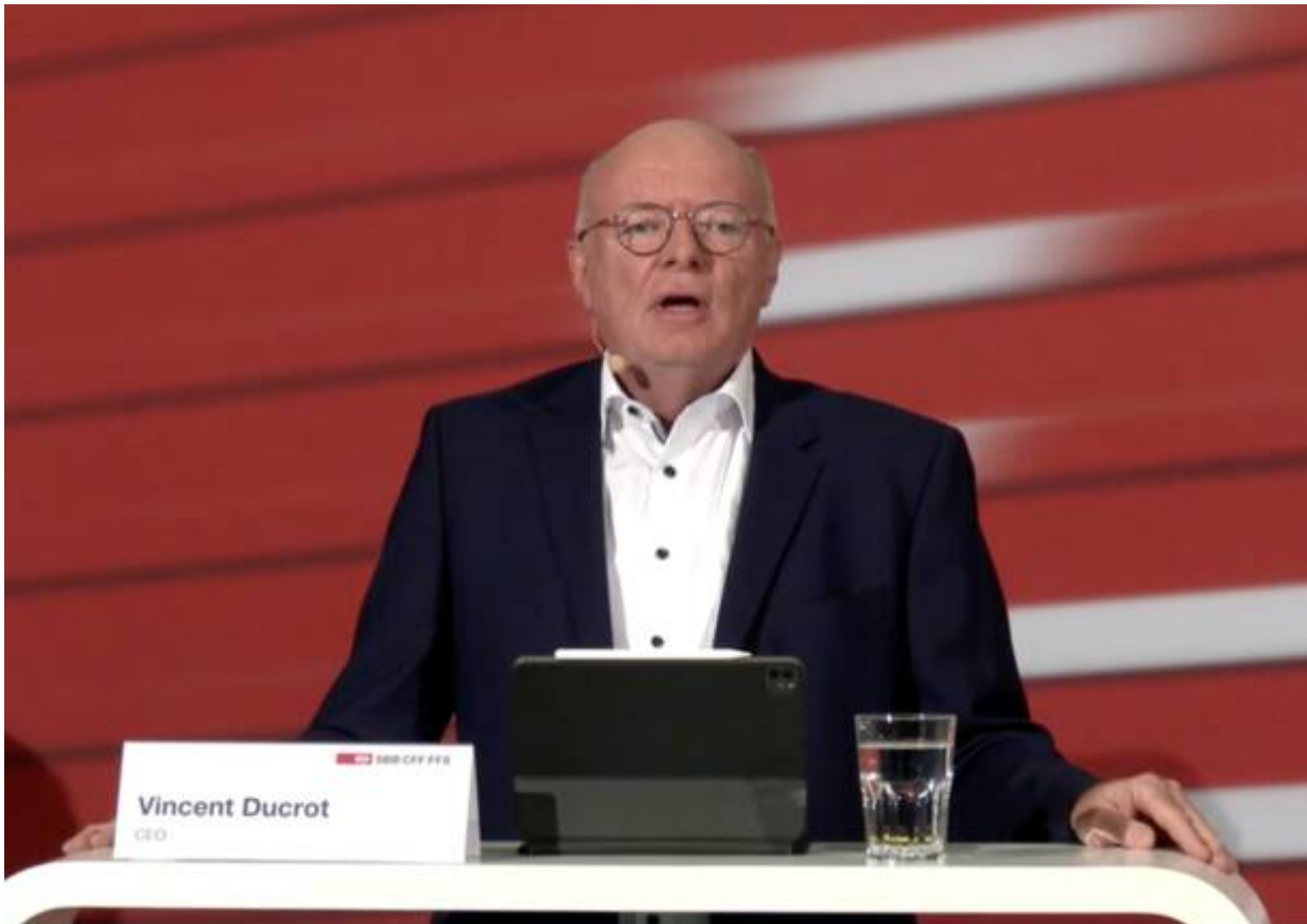
Il Ceo delle Sbb Vincent Ducrot

Tuttavia solo alcuni trasporti di transito e di import/export possono essere gestiti tramite la storica linea di montagna . Poiché il materiale rotabile adibito al traffico di transito combinato non è adatto a circolare sulla storica linea di montagna, FFS Cargo utilizza le capacità disponibili per i trasporti nazionali. Per il traffico di transito combinato, SBB Cargo International al momento sta utilizzando la deviazione sulla linea del Lötschberg per circa il 30% del proprio volume di merci.