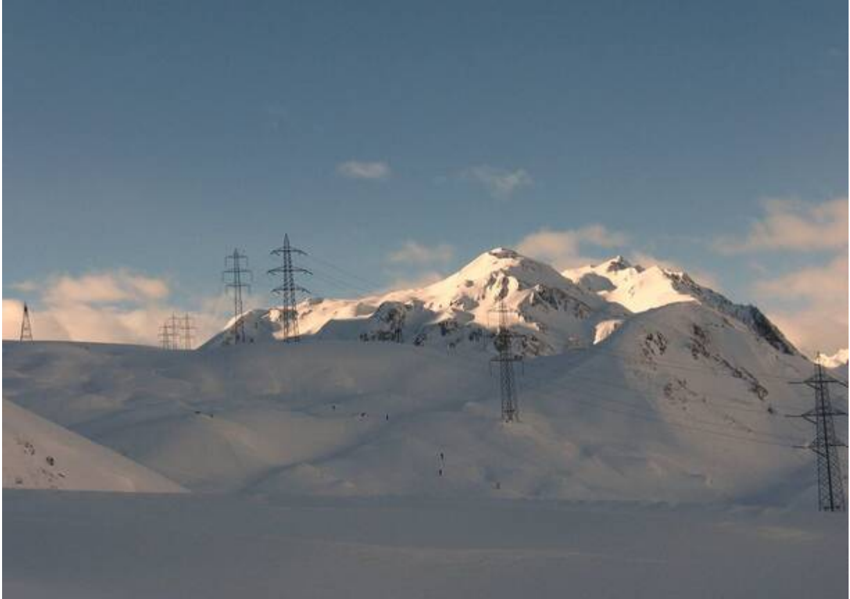
La zona sopra il lago di Toggia.

Le ricerche hanno poi permesso di ritrovare le due persone, una sepolta nella neve e l'altra spinta dalla valanga nelle acque del lago di Toggia (un bacino artificiale per produzione elettrica).