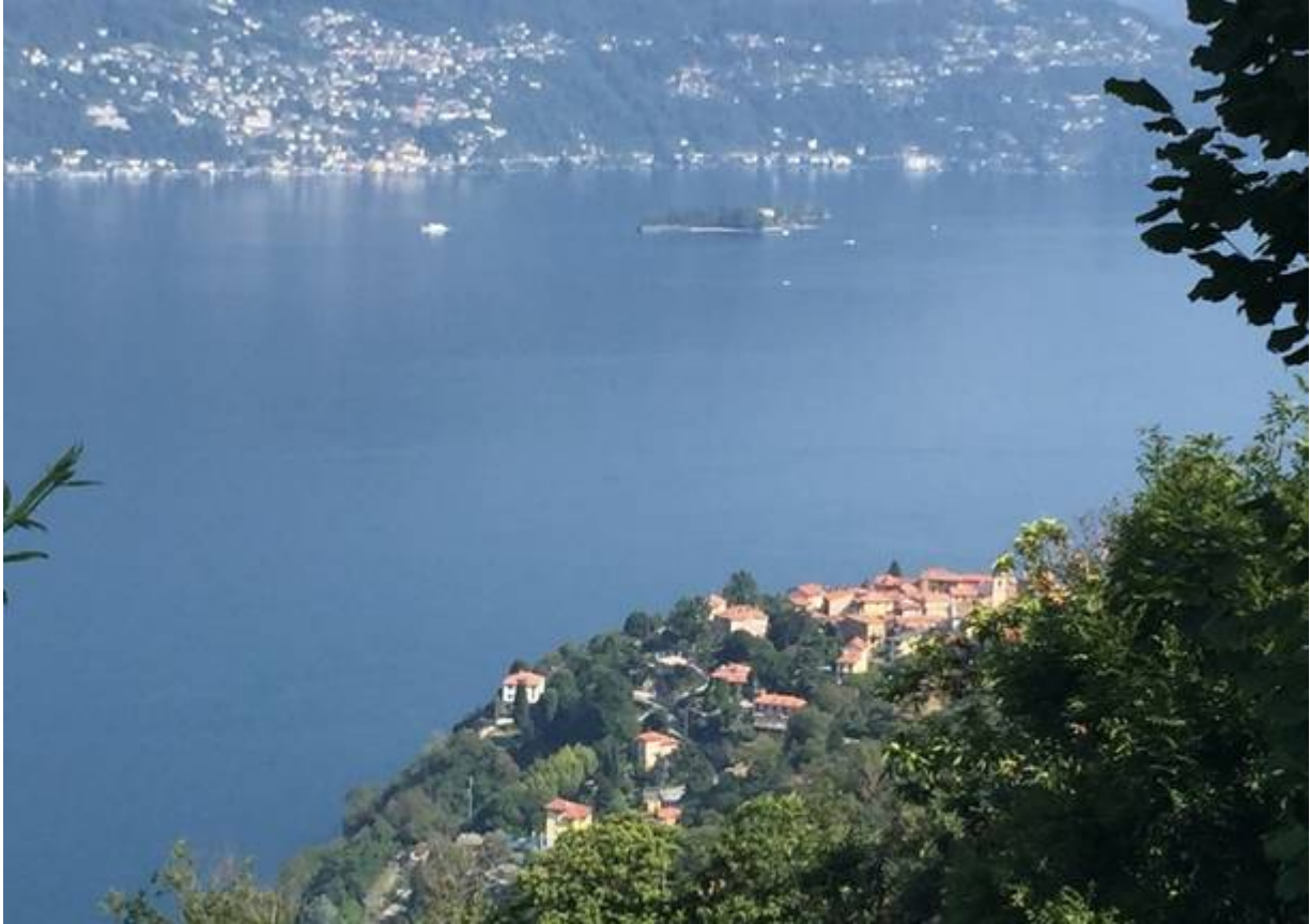
Tronzano Lago Maggiore