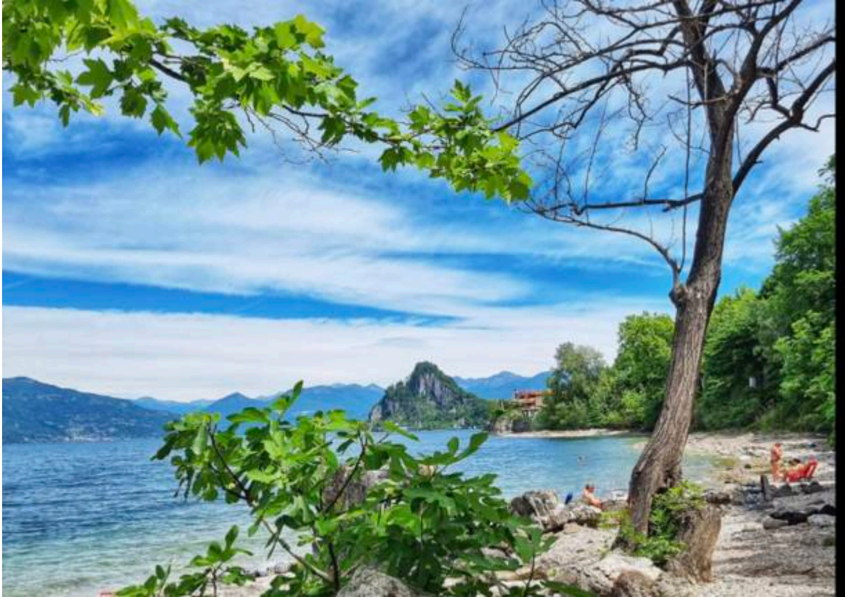
Spiaggia 5 Arcate